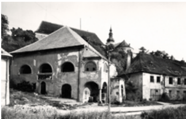
Zdroj: internet: www.10hvzd.cz/cs/objekt/mikulov/o-komunite , (cit. 02.05.2019)